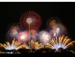
土浦全国花火競技大会

「日本三大花火大会」とコラボレーションしたイルミネーションによる新感覚花火大会。都会のまん中で、毎晩光のショーを開催！各花火大会の事務局監修のもと、イルミネーションと音で各大会の名物プログラムを実施します。【2P】