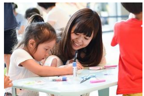
▲ 過去の開催の様子