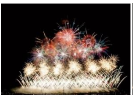
大曲全国花火競技大会