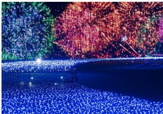
▲イルミネーションによる花火で毎晩「日本の夏」が楽しめるサマーライトガーデン(昨年の様子)