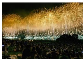
長岡まつり大花火大会