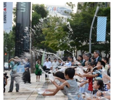
▲過去の開催の様子