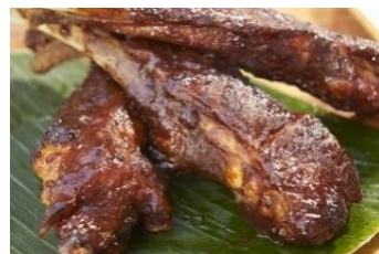
▲芳醇な薫りを楽しめるラム「バカルディ8」に漬けこみ、柔らかく仕上げたスペアリブバカルディ8 (900円/本) ※イメージ