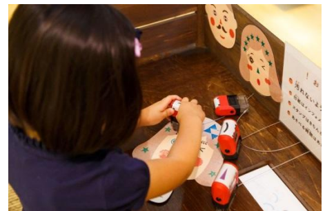
▲ 過去の開催の様子