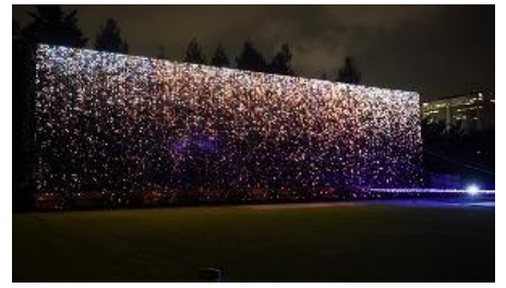
▲高さ約 10m×横幅約 30mの壁面に現れるナイアガラ(昨年の様子)

各花火大会が誇る自慢のプログラムを、実施期間をわけて開催。各花火大会事務局監修のもと、東京のまん中でイルミネーションと音でお楽しみいただけます。都心の夏の夜空を華麗に彩る光の花火を、ぜひご堪能ください。