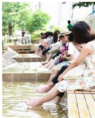
▲小川で楽しむ ASHIMIZU(アシミズ)や館内の風鈴が「日本の夏」を感じさせる(イメージ)