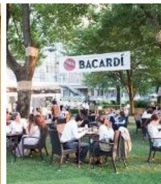
※ミントが清涼に香るモヒートを屋外で楽しむカフェ(昨年の様子)

東京ミッドタウン(事業者代表 三井不動産株式会社)は、2016年7月15日(金)から8月28日(日)までの期間、10年目となる夏イベント『MIDTOWN ♥ SUMMER 2016』(ミッドタウン ラブズ サマー)を開催いたします。