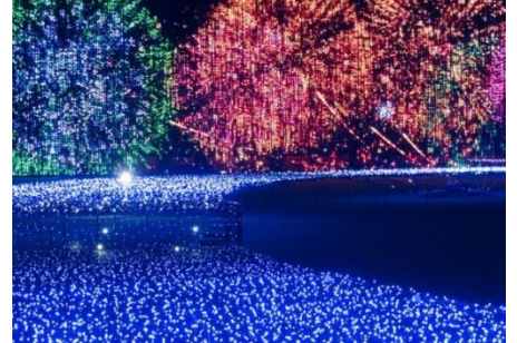
▲1時間に3回、花火の演出が行われる(昨年の様子)

【場 所】 芝生広場 【料 金】 無料 【主 催】 東京ミッドタウン 【協 力】 長岡まつり協議会、大曲商工会議所、 土浦全国花火競技大会実行委員会