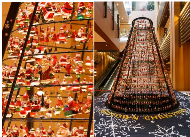
▲小さなサンタが約1,800体登場