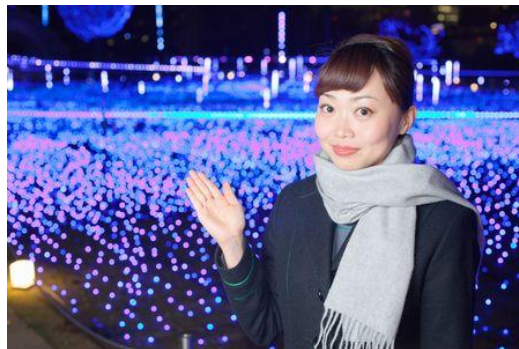
▲イルミネーションツアーの様子