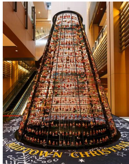
▲約 1,800 体のサンタが飾られるサンタツリー【詳細 P4】