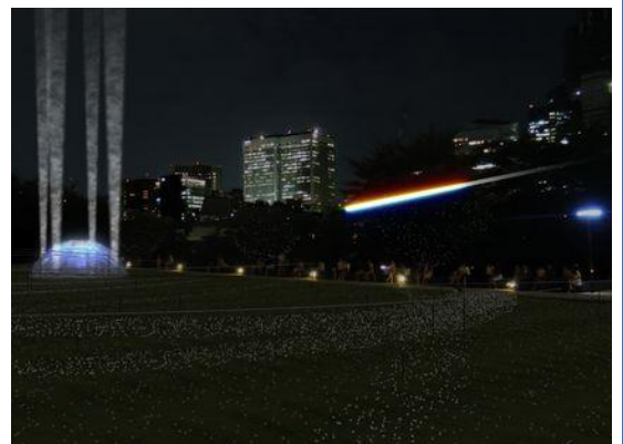
▲流れ星演出 イメージ

「スターライトガーデン」は見る角度によって異なる光景を楽しむことが特徴のひとつです。青い光越しに眺める東京タワーやレストランからの景色など、様々な角度からお楽しみいただけます。