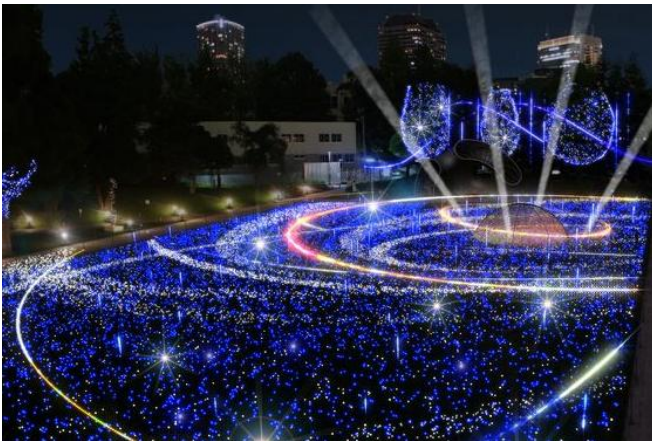
▲スターライトガーデン 2016 イメージ

上空約100mの高さまで光を放つ4本のサーチライトを新たに導入。フルカラーLEDを使用した直径約6mのヴィジョンドーム(2015年初登場演出)と、そこから放たれるサーチライトの演出で、宇宙の始まりとされるビッグバンなどの様々な宇宙現象を表現します。宇宙を描き続けてきた「スターライトガーデン」が、さらにスケール感のある演出で登場します。