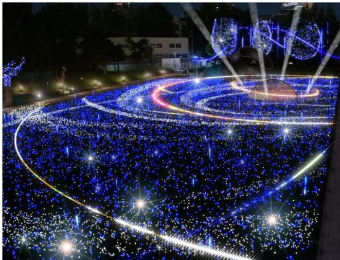
▲ダイナミックに進化する「スターライトガーデン 2016」イメージ【詳細 P2】