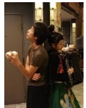
プラノワ (サウンドジャグリング)