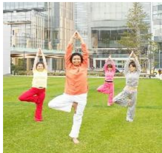
PARK YOGA (パーク ヨガ) イメージ