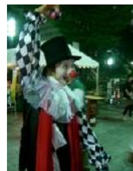
JIDAI (ウォーキングアクト)