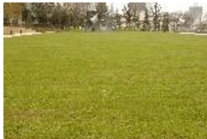
ミッドタウン・ガーデン 芝生広場