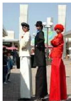
SPEC (ウォーキングアクト)