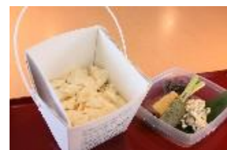
京乃とうふや藤野