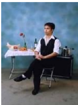
チクリーノ (パントマイム)