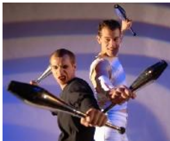
PARK PERFORMANCE (パーク パフォーマンス)

『OPEN THE PARK』は、“公園で過ごす休日”をコンセプトに、ミッドタウン・ガーデンにある約 2,000 m 2 の芝生広場を会場として、世界有数のアーティストのパフォーマンスや、屋外ライブラリー、ヨガなど、様々なイベントを実施します。また、新緑の季節となるイベント期間中は、ミッドタウン・ガーデンを臨めるレストランのテラス席はもちろん、緑のオープンスペースの中でも食事を楽しんでいただけるよう、レストランやカフェではランチボックスを販売。東京ミッドタウンならではの、豊かな緑の魅力を五感で存分にお楽しみいただけます。