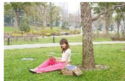
PARK LIBRARY (パーク ライブラリー) イメージ