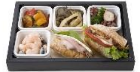
DEAN & DELUCA (ディーン&デルーカ)