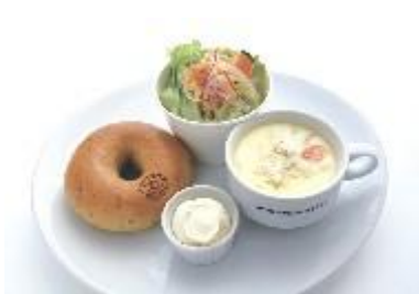
JUNOESQUE BAGEL CAFE (ジュノエスクベーグル カフェ)