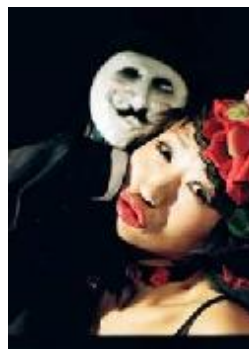
バーバラ村田 (パントマイム)