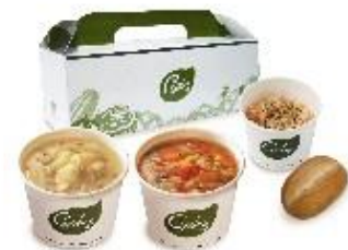
PARK LUNCH BOX (パーク ランチ ボックス) メニュー例