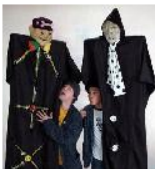
FUNNY BONES (パペットパフォーマンス)