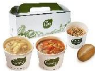
Chowder's Select Soup! (チャウダーズ セレクトスープ!)