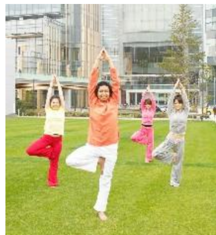
PARK YOGA (パーク ヨガ) イメージ