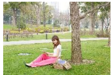
PARK LIBRARY (パーク ライブラリー) イメージ