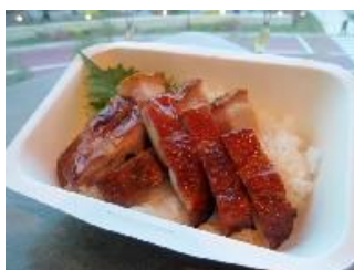
SILIN 火龍園 (シリノファン・ロン・エン)