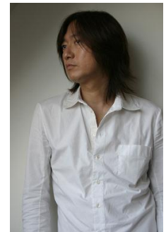
ap bank 代表:小林武史さん

音楽だけでなく、環境など様々な分野で総合エンターテインメントのプロデューサーとして定評のある小林武史さんが、東京ミッドタウン 5 周年の食や音楽をプロデュースします。