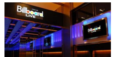
▲ビルボードライブ東京

【名 称】 Tokyo Midtown 5th Anniversary Premium Live meets Food Relation Network by ap bank / kurkku 【日 時】 3月31日(土)15:30 開場、16:30 開演(予定) 【場 所】 ビルボードライブ東京 (ガーデンテラス 4F) 【出 演】 ※近日発表 【主 催】 東京ミッドタウン 【協 力】 ap bank / kurkku 【後 援】 TOKYO FM 【チケット】 貸切公演(一部招待制)※東京ミッドタウン特設WEBサイトにて応募受付、無料