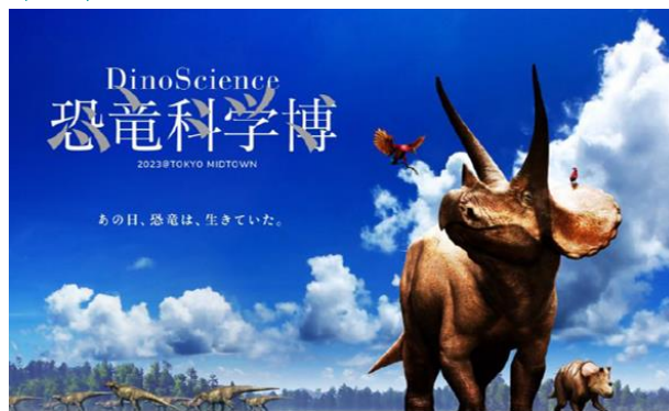
▲『DinoScience 恐竜科学博』イラスト:恐竜くん (C)Masashi Tanaka