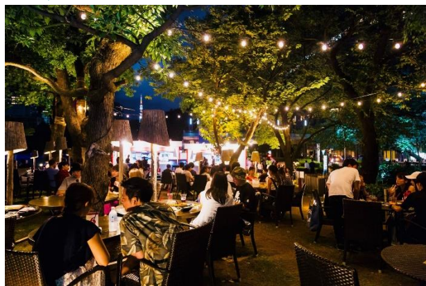
▲過去のイベントの様子

暑い夏に木々がつくり出す木漏れ日を眺めながら涼を感じる期間限定の「MIDPARK LOUNGE」がミッドタウン・ガーデンに登場。暑い夏にぴったりのハーブやスパイスを活かしたメニューや涼やかなメニューなどお楽しみいただけます。緑に包まれ風も心地よい空間で、東京ミッドタウンならではの開放的なラウンジをお届けします。