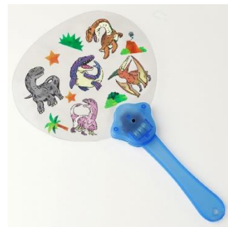
▲イメージ (光るダイナソーうちわづくり体験)