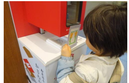
▲過去のイベントの様子