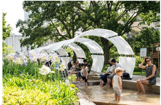
▲過去のイベントの様子