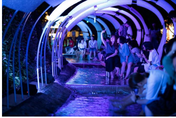
▲過去のイベントの様子

ミッドタウン・ガーデンを流れる小川に足を浸し、都会にいなながら夕涼みをご体験いただける、「ASHIMIZU」が登場。今年はひんやりとしたミスト(霧)で、さらに涼しさを感じていただけます。