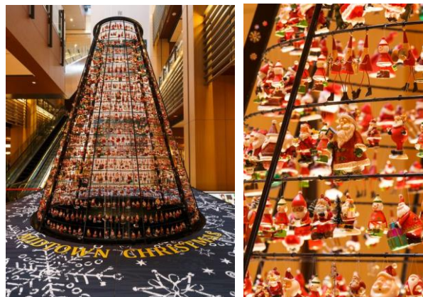
▲小さなサンタが約 1,800 体登場

【期 間】 11 月 15 日(水)～12 月 25 日(月) 【時 間】 11:00～24:00(ガレリア開館時間) 【場 所】 ガレリア1F ツリーシャワー