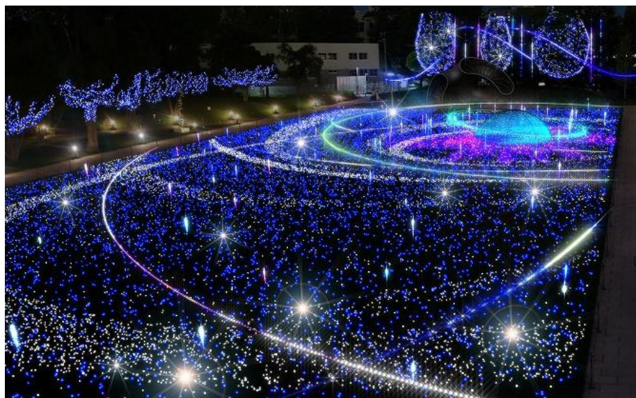
▲曜日ごとに異なる演出！「スターライトガーデン 2017」(イメージ)

東京ミッドタウン(事業者代表 三井不動産株式会社)は、2017年11月15日(水)から12月25日(月)の期間、今年で10周年を迎えるクリスマスイベント『ミッドタウン・クリスマス 2017』を開催いたします。