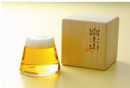
▲富士山グラス 4,078円 (鈴木啓太)

「Tokyo Midtown Award」デザインコンペでこれまでに商品化・イベント化された受賞作品は、計15作品となりました。累計23万個以上売り上げている「富士山グラス」やG7伊勢志摩サミットのお土産にも採用され、累計100万個以上を売り上げた「歌舞伎フェイスパック」など、これまでに商品化された受賞作品は人気商品となっています。今後も「Tokyo Midtown Award」にご注目ください。