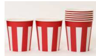
▲おめでたい紙コップ

期間中、「HAPPY HALF BOX」で撮影した画像を指定のハッシュタグ (#MIDDAY / #midtown_amb)をつけて Instagram に投稿いただき、プラザ B1「インフォメーションカウンター」へ投稿画面をご提示いただくと、毎日先着 10 名様に新しい半年のお祝いにピッタリな「おめでたい紙コップ」をプレゼントいたします。(受付時間 11:00～19:00)