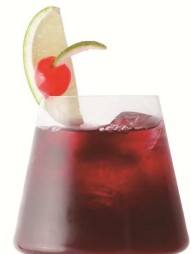
▲ミッドルージュ 800 円(税込) (GRILL & WINE GENIE'S TOKYO)