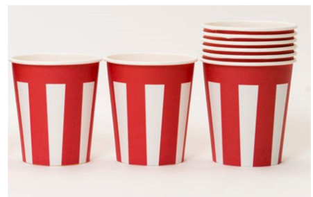
▲おめでたい紙コップ 637円(50個入り) (井下 悠)

今回の「まんなかのキャンパイ！」企画にも使用されている今や23万個を売り上げた富士山グラス。デザイナーの鈴木氏は、デザインコンペ審査員の水野学氏とプロダクトデザインブランド「THE」を立ち上げるなど活躍しています。