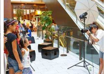
▲2014年のMID DAY初開催の様子(上・下)

「Tokyo Midtown Award」デザインコンペでこれまでに商品化・イベント化された受賞作品は、計15作品となりました。累計23万個以上売り上げている「富士山グラス」やG7伊勢志摩サミットのお土産にも採用され、累計100万個以上を売り上げた「歌舞伎フェイスパック」など、これまでに商品化された受賞作品は人気商品となっています。今後も「Tokyo Midtown Award」にご注目ください。