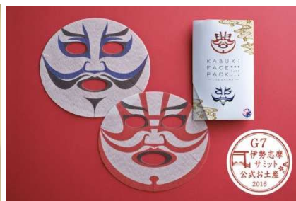
▲歌舞伎フェイスパック 900円 (小島 梢)