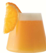
▲オレンジビア 810 円(税込) (orangé)