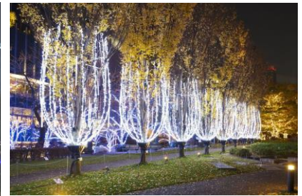
▲「シャンパン・イルミネーション」