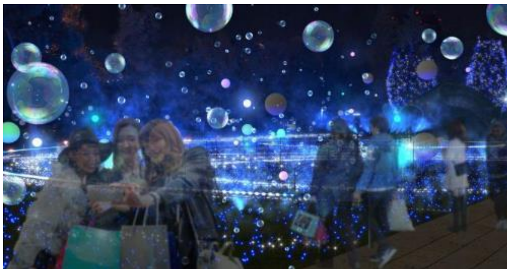
▲空間全体に広がるしゃぼん玉と光るバルーンの期間限定特別演出 「しゃぼん玉イルミネーション」(イメージ)

透明度が高く、小ぶりで軽量のしゃぼん玉である「クリスタルしゃぼん」と、大ぶりでゆったりと漂い光を受けやすく、はじけた瞬間にスモークとなって消える「スモークしゃぼん」の 2 種類のしゃぼん玉が光とともに上空に舞い上がります。この『しゃぼん玉イルミネーション』の演出は、12 月 16 日(日)までの期間限定。星くずが漂うような臨場感あふれる演出にご期待ください。