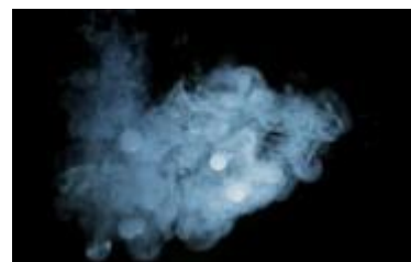
▲「スモークしゃぼん」が はじける様子