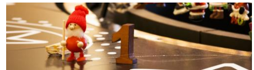
▲小さなサンタが約1,800体登場