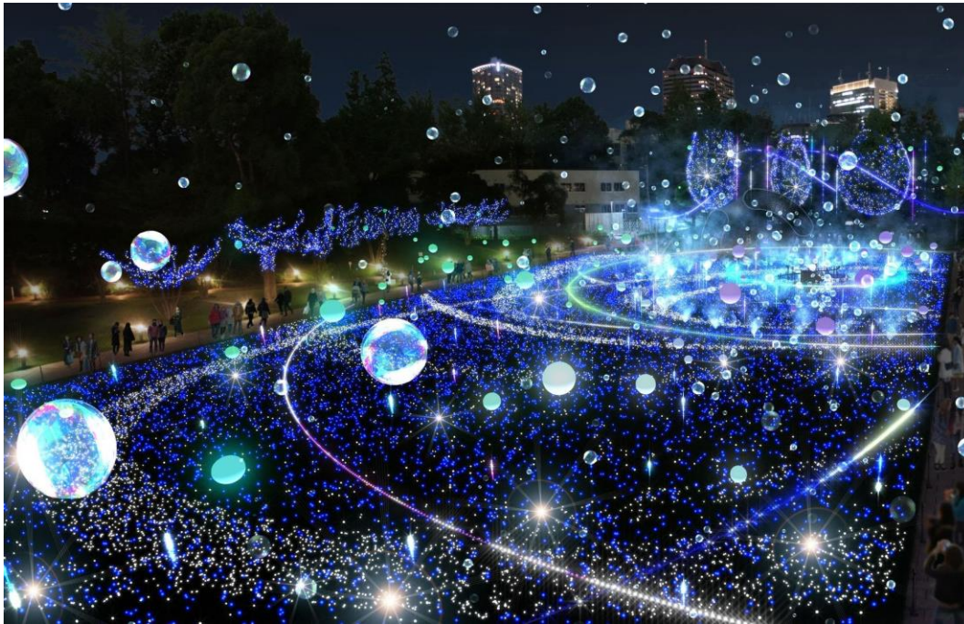
▲空間全体に広がるしゃぼん玉と光るバルーンの期間限定特別演出「しゃぼん玉イルミネーション」(イメージ)

1日約45万個のしゃぼん玉×約100個のバルーンでスターライトガーデンが幻想的空間に！