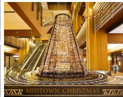
▲約1,800体のサンタで飾られる「サンタツリー」

東京ミッドタウン(港区赤坂 / 事業者代表 三井不動産株式会社)は、2018年11月13日(火)から12月25日(火)の期間、クリスマスイベント『MIDTOWN CHRISTMAS 2018(ミッドタウン クリスマス)』を開催いたします。