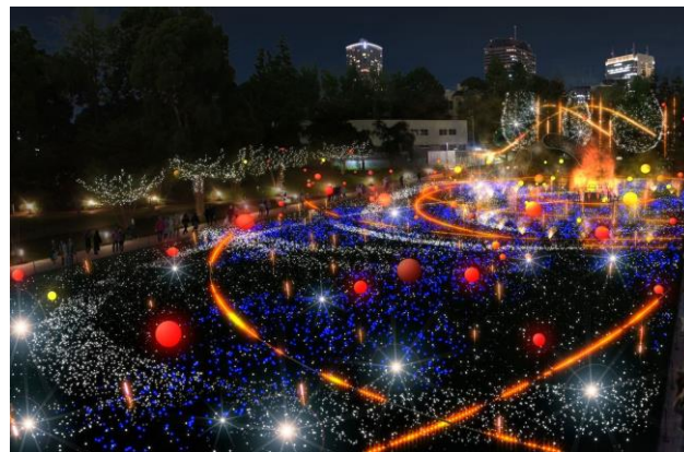
▲今年初登場の光るバルーンを約 100 個設置。より華やかにスターライトガーデンを彩ります(イメージ)