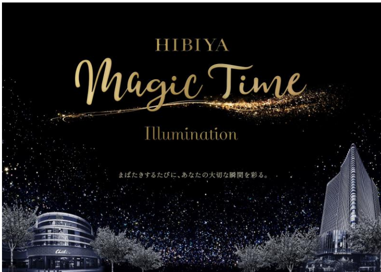
▲HIBIYA Magic Time Illumination キービジュアル