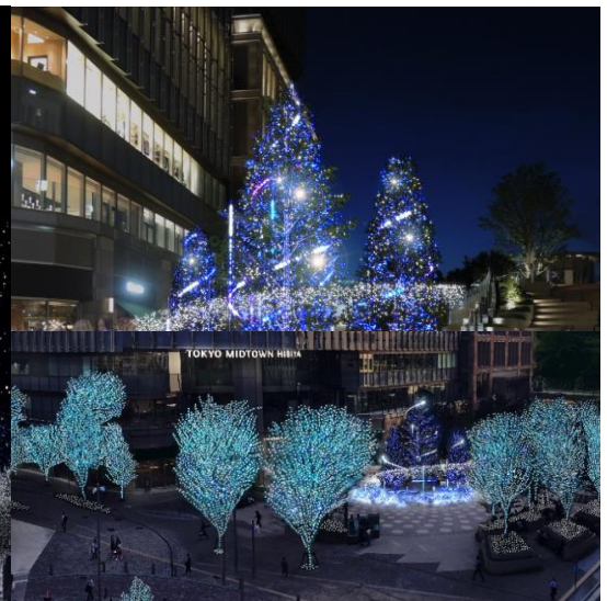
▲スターライトツリー イメージ(右上) ▲日比谷エリアイルミネーション イメージ(右下)