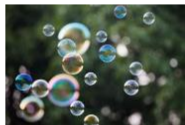
▲「クリスタルしゃぼん」