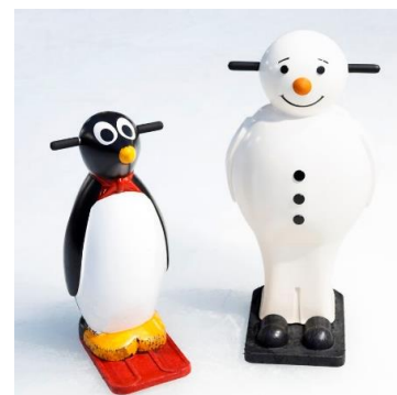
▲お子さまに人気のそり