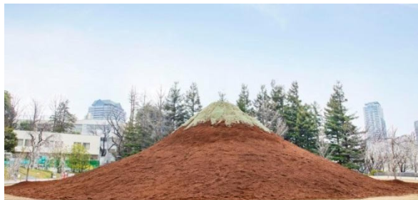
▲江戸富士(日中の様子)