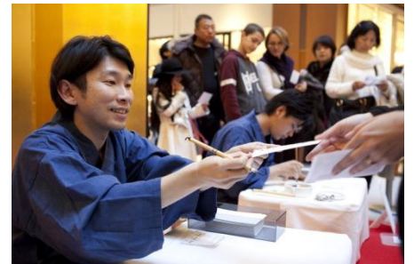
書で綴る凧 イメージ