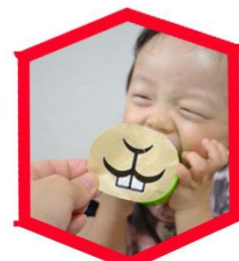
福笑い連凧 イメージ ワークショップで作った凧は 九頭「絵」馬と共に館内を飾ります