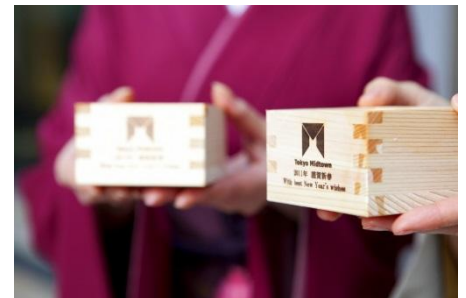
振る舞い酒 イメージ