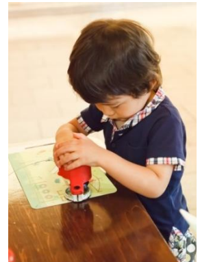
七福神スタンプラリー イメージ