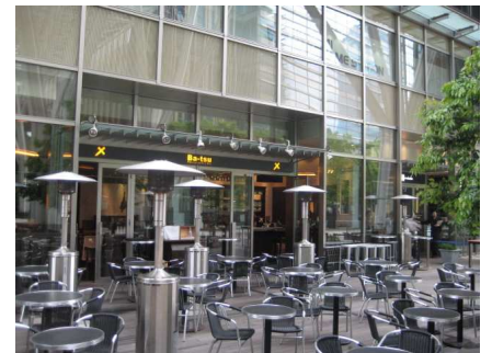
Ba-tsu(プラザ) のテラス席