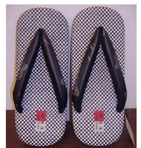
ZETTA: 10,710 円(税込)

A. やはり今夏は冷房を控えることが予想されるためか、素足でお履き頂ける ZETTA (メンズ)や花緒サンダル(レディース)が好調です。蒸れない履物を探しているということでご来店される方が多く、私服勤務のビジネスマンの方からは社内履きとして ZETTA をご購入頂くこともあります。