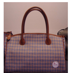
伊勢木綿のバッグ: 17,850 円(税込)

A. 今年、新発売になった伊勢木綿のバッグがおすすめです。伊勢木綿ならではの風合いの柔らかさや軽やかさがあるので、夏にピッタリの商品です。