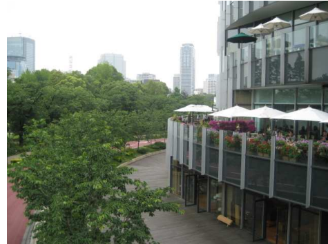
Pizzeria-Trattoria Napule (ガーデンテラス) のテラス席