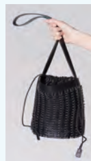
9. paco rabanne

1965年に誕生したパリのクチュールブランド〈パコ・ラバンヌ〉。旬の立体的なフォルム、斬新な素材使いに、他のブランドとは異なる印象を受けるバッグをご紹介します。人気の「BUCKET」の他、17FW新作商品を取り揃えております。