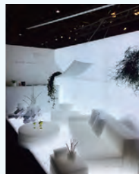
4. MIYABIE maison koichiro kimura

〈ミヤビエ〉はポリエチレンをはじめとする樹脂を溶解し、水の中に開放し生まれた、芸術的な構造体。網状の形状で、水や空気や光を通すため、花器や照明からファッション、フレグランスなどデザイナーとのプロジェクトにより、さまざまな作品が生まれています。また、特許からリサイクル、再生に至るまで、一貫したアースコンシャスな活動をおこなっており、次の未来のライフスタイル創造を提案いたします。