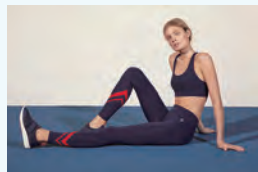
3. TORY SPORT