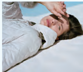
3. Max Mara