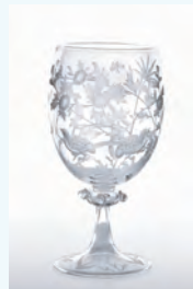
2. Miarka / エングレイブド グラス ゴブレット (うずら)