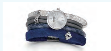
8. Kranz & Ziegler

その日のファッションやシーンによって組合せを変えて、色々な自分を表現できる、まさにオリジナルのストーリーを描き楽しむ事ができます。