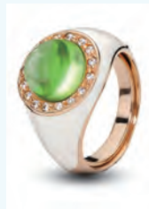
7. HOUSE OF AMBER