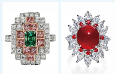
11. カラーダイヤモンド&ビルマルビー 特別ご招待会

■1月26日(土)~28日(月) ■イセタンサローネ2階サロン グリーンやブルーといった希少なカラーダイヤモンドを美しいジュエリーに手掛けるニューヨークジュエラー〈スコット・ウェスト〉。ビルマ産非加熱ルビーやカシミールサファイアを数多く有するジュエラー〈ファイディー〉。その他ダイヤモンドの高品質なルース等、特別に手配したジュエリーと宝石をご紹介します。期間中、G.G(宝石学修了者)が宝石に関するご相談を承ります。