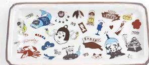
1. KUTANI SEAL