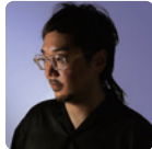
青木竜太 芸術監督 / 社会彫刻家