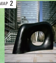
「妙夢(みょうむ)」 安田 侃 ○ プラザ 1F