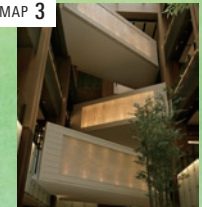
「鎮守の森」 堀木 エリ子 ○ ガレリア