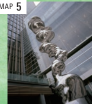
「ファナティックス」 トニー・クラッグ ○ 芝生広場