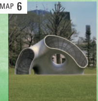
「フラグメント No.5」 フロリアン・クラール ○ 芝生広場