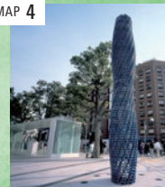
「ブルーム」 シラゼー・ハウシャリー&ビップ・ホーン ○ ガーデン入口付近