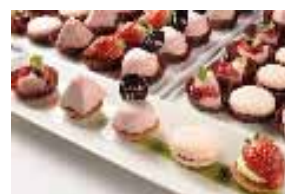
マコリーヌ特製プティフル 3Pセット 500円