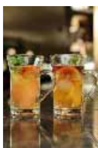
フルーツカクテルワイン 600円

着物のお客様には、特典として、ベビーシャンパン（1,000円）＋タパスボックス（650円）を特別価格1,000円にて提供します。