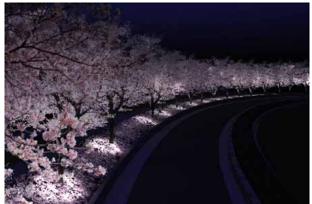
地面に散った花びらを光ファイバーで表現（イメージ）