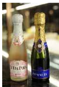
ベビーシャンパン 1,000円～