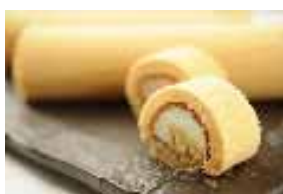
桜ロールケーキ “SAKURA”2種セット 500円