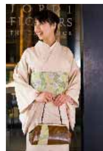
レンタル着物イメージ 着物：awai