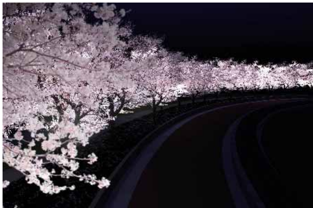
桜のライトアップ（イメージ）

ESAG ECOLE SUPERIEURE D'ARTS GRAPHIQUES ET D'ARCHITECTURE INTERIEURE（パリのグラフィック専門学校）