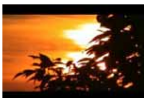
九州大学 芸術工学部 映画研究部 学生作品イメージ（既存作品抜粋）