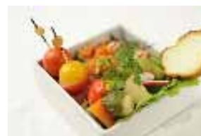
タパスボックス 650円