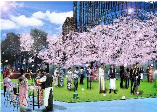
「桜カフェ」イメージパース

そして、昨年好評を博した「桜カフェ」は、“桜×着物”という新しいコンセプトを加えて再登場。日本の伝統文化である着物を気軽に楽しむひとつの機会として、お花見の新しいスタイルを提案。着物で気軽に立ち寄ることが出来るスタンディング形式のカフェや様々なイベントをご用意しております。