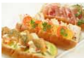
オープンドッグサンド 各600円～