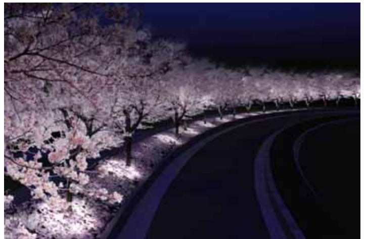
夜桜ライトアップ「SAKURA STORY」イメージパース