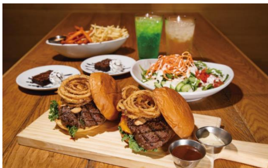
▲写真は 2 名様分