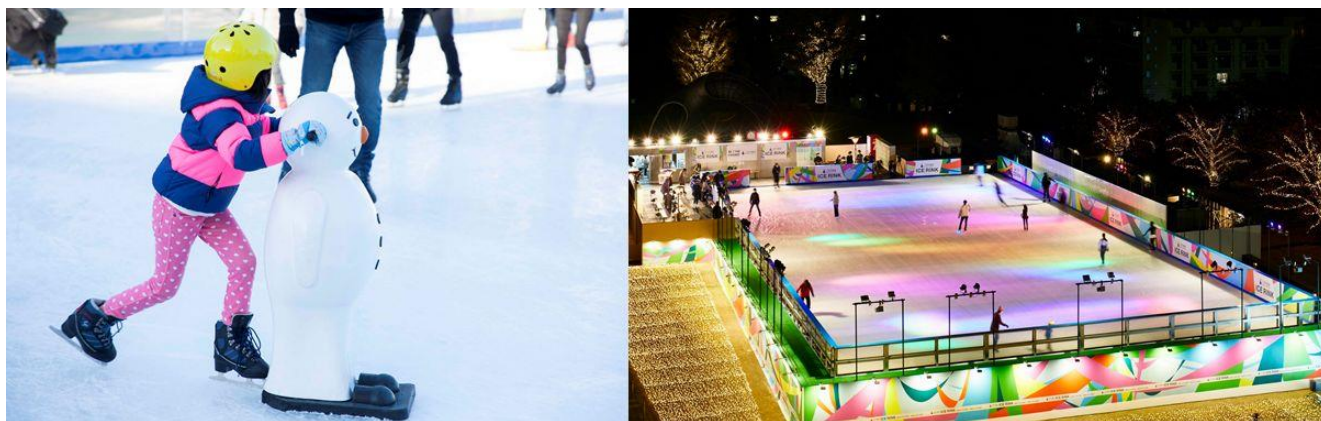
▲(左)昼のイメージ (右)夜のイメージ

東京ミッドタウンの冬の風物詩、「MITSUI FUDOSAN ICE RINK(三井不動産 アイスリンク)」が今年もウィンターシーズンを通してお楽しみいただけます。都内の屋外スケートリンクでは最大級かつ、本物の氷の上でスケートができるアイスリンクは、夜になると氷上をキャンパスに見立て、光が絵を描くように幻想的で色彩豊かな演出が加わります。澄み切った冬の空の下、ガーデンの木々と都会のビル群に囲まれた、この街ならではのスケート体験をぜひお楽しみください。