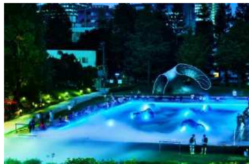
▲霧演出: 夕時 静かな光と霧で幻想的な空間を体験いただけます