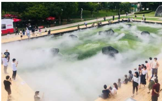
▲霧演出: 昼時 霧に包まれた時のひんやり感を表現しています

広大な芝生広場に現れた庭園を、ひんやりとした霧が包み込むデジタルアート庭園の演出が決定いたしました。夜には庭園内に点在する石を中心に、花火や砂紋をイメージした色とりどりの光が放たれます。制作と演出はエクスペリエンスマーケティングカンパニー「博展」と、ビジュアルデザインスタジオ「WOW」が手がけます。