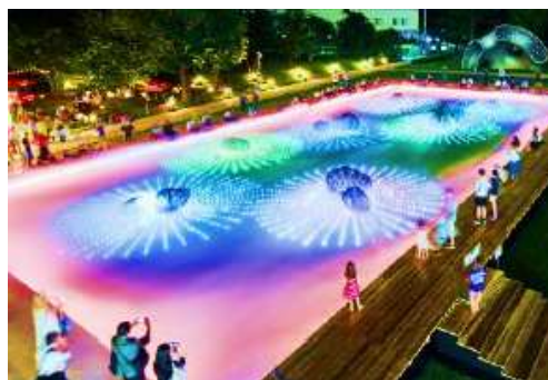
▲デジタル花火演出: 夕時 花火の一瞬の輝きと散りゆく光をデジタルで表現しています