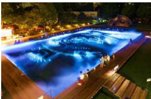
▲砂紋演出: 夕時 光によって表現される砂紋を眺めながら心静かに過ごいただけます