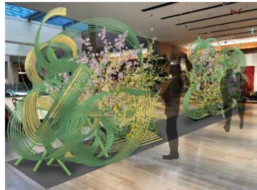
▲大地讃頌(だいちさんしょう)イメージ