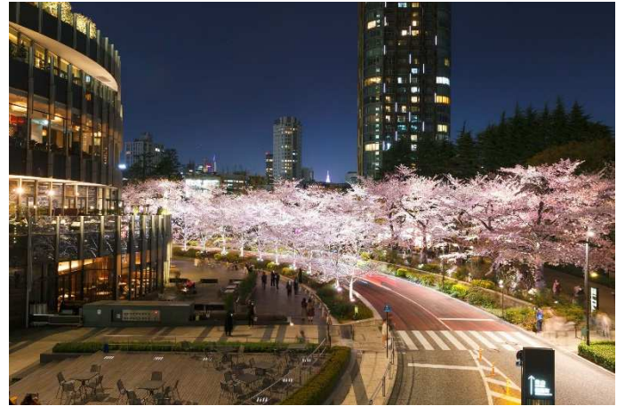
▲昨年の様子 全長約 200m の桜並木は、昼と夜で異なる雰囲気を楽しめます