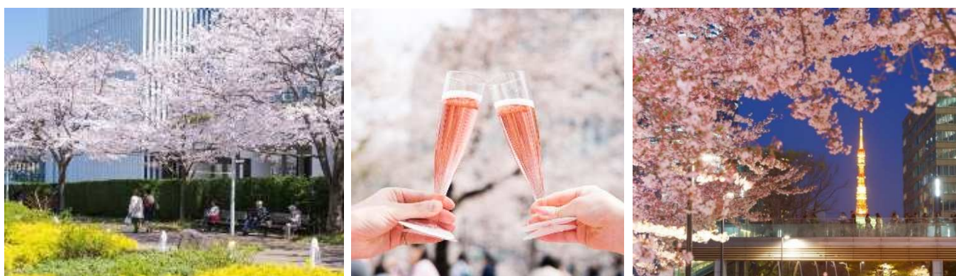
▲過去の開催の様子

本イベントは「春を祝う」をコンセプトに開催し、今年で13回目を迎えます。東京ミッドタウンのガーデンエリアに咲く桜はもちろんのこと、スパークリングワインやこだわりのスイーツ、館内のフラワーディスプレイなど、さまざまなイベントで来たる春を祝います。