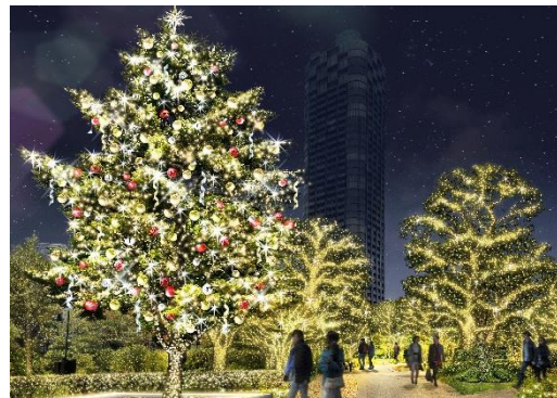
▲Timeless Gold Tree(イメージ)