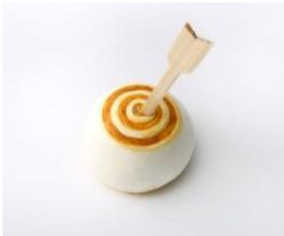
▲「ATARI MANJU」イメージ 2013 年 12 月中旬発売予定

「Japanese New Souvenir 日本のおみやげ」をテーマに作品を募集した「Tokyo Midtown Award 2008」<デザインコンペ>学生の部で、準グランプリを受賞した作品「JAPANESE、FACE」をもとに商品化されました。「一見距離を感じる伝統の文化を、日常に浸透している文化に」という作者の想いのもと、歌舞伎の隈取を自分の顔に被せ、美しくなるまでの時間に楽しめるようフェイスパックにした作品で、見た目のインパクトや「日本らしいお土産」としてのデザインが評価され、商品化が決定しました。監修は歌舞伎俳優の市川染五郎さんが担当されます。