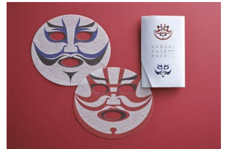
▲左:「船弁慶」平知盛の霊の隈取 右:「暫(しばらく)」鎌倉権五郎景政の隈取

「Japanese New Souvenir 日本の新しいおみやげ」をテーマに作品を募集した 2008 年度の<デザインコンペ>からは、富士山をモチーフにした「富士山グラス」を含む計 4 作品が商品化されました。5 作品めの商品化となる「JAPANESE FACE 歌舞伎フェイスパック」は、歌舞伎の隈取をフェイスパックにデザインした作品。非日常の「顔」を自分の「顔」で楽しめるユニークな商品として、歌舞伎座を中心に歌舞伎関連商品を扱う一心堂本舗株式会社より発売が決定しました。歌舞伎役者の市川染五郎さんが監修の元、人気演目「船弁慶」と「暫」から本格的な隈取を再現。パッケージには、美容液を染み込ませたフェイスパック 2 つと、日本語・英語で商品や歌舞伎、隈取を紹介したパンフレットが同梱されています。