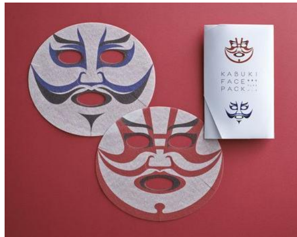
▲「JAPANESE FACE 歌舞伎フェイスパック」イメージ 2013 年 12 月 6 日(金)発売予定