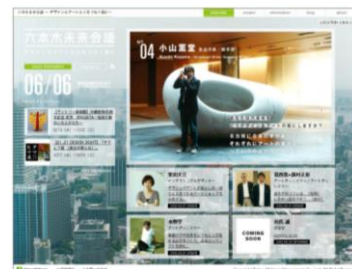
▲ 六本木未来会議 イメージ