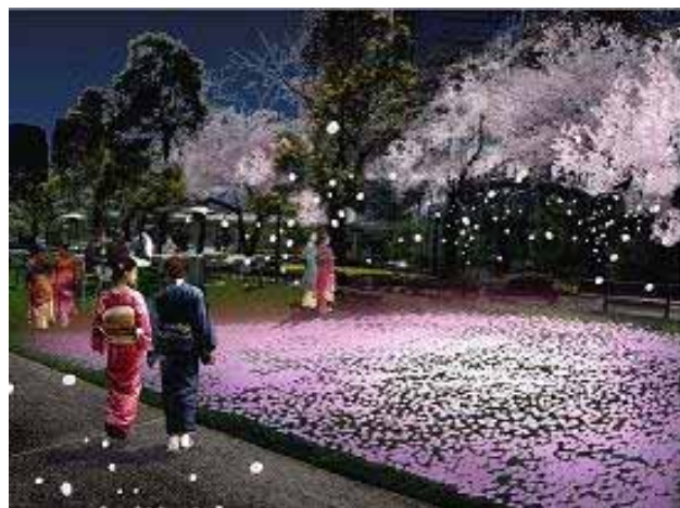
「芝 SAKURA」ライトアップ(イメージ)