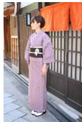
レンタル着物イメージ 着物：コエトイロ