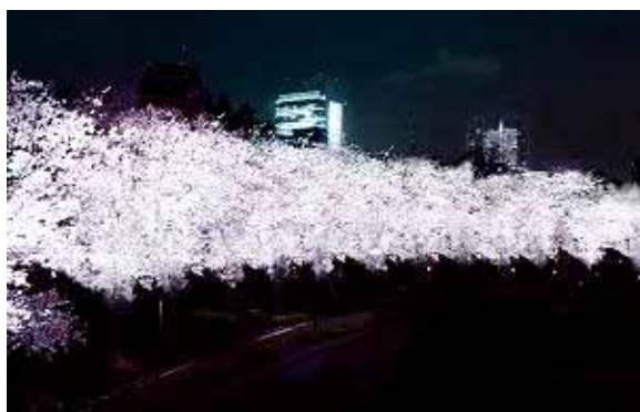
「Sakura Effect」通常ライトアップ時(イメージ)

1974年長崎県出身。2000年東京理科大学大学院建築学卒業後、隈研吾都市建築設計事務所を経て渡米。2002年コロンビア大学大学院建築学科AADを卒業後、同大学院助手。中国・広東省佛山市体育館の設計主任を経て、2005年アーキコンプレックスを設立し、日本国内での活動を開始。ホテルや美術館、住宅などの建築に携わるほか、学術活動も行う。近年の作品に、富士重工業国際モーターショーブース、三國清三氏ホテル&フレンチレストラン「オーベルジュ・ド・ミクニ」など。