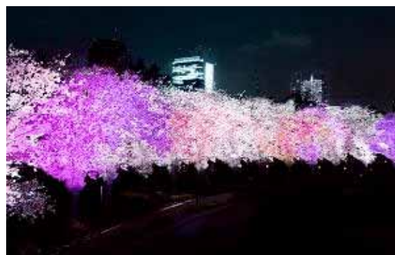
「Sakura Effect」演出パターンの1つ「バタフライ エフェクト」(イメージ)