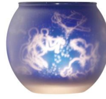
「トゥインクルステラ」