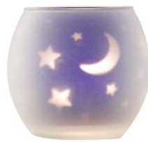
「ムーン&スターライト」