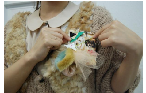
メモリアルブローチ イメージ

古着や家に眠る布やリボンなどを持ちより、お互いに材料を交換しながら自分のオリジナルブローチをつくる「メモリアルブローチ」のワークショップ