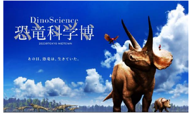
▲『DinoScience 恐竜科学博』イラスト:恐竜くん (C)Masashi Tanaka