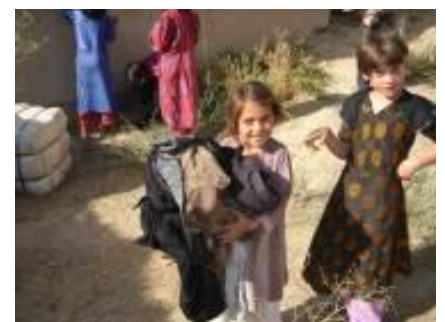
▲NPO 法人 日本救済衣料センター 過去の寄贈の様子

※三井不動産グループの運営する商業施設において、春と秋の年2回、同様の活動を実施しています。