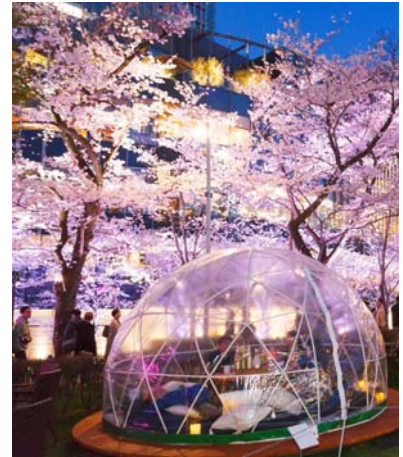
▲昨年の様子 花冷えの夜も過ごしやすい、好評のドーム型テント席も登場