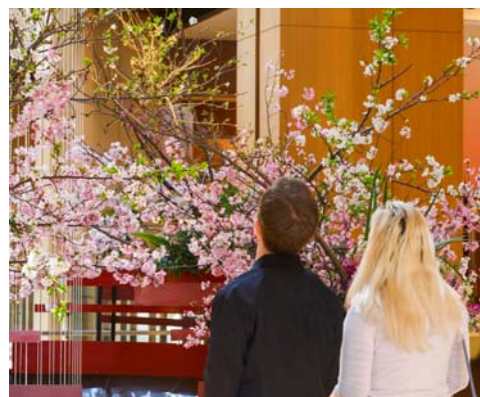
▲昨年の様子 (ガレリア)