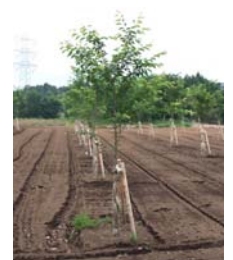
▲左：2017 年の植樹の様子 右：接ぎ木をして育てている苗木