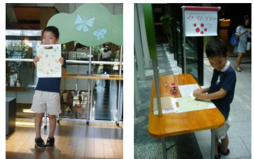
▲昨年のスタンプラリー実施風景