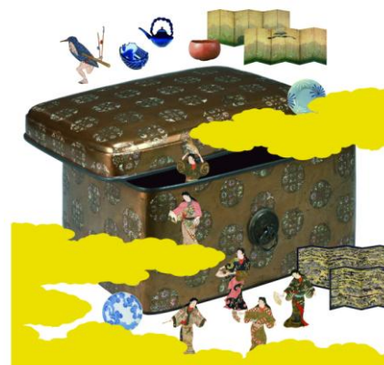
▲「おもしろびじゅつワンダーランド」展イメージ