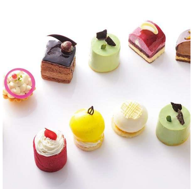
▲季節で変わる宝石のような姫ケーキ。