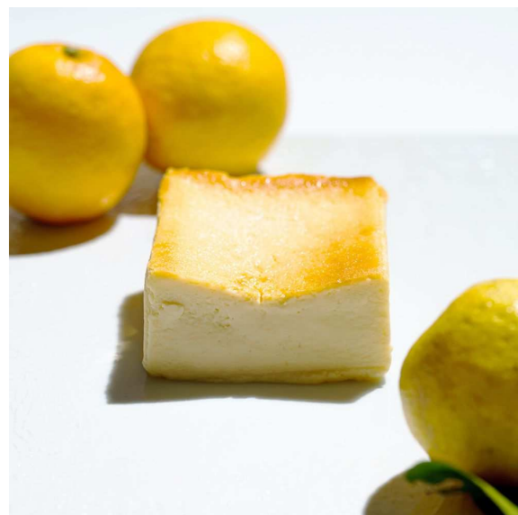
▲すっきりとした甘みとやさしい香りの余韻が楽しめるハニーライム