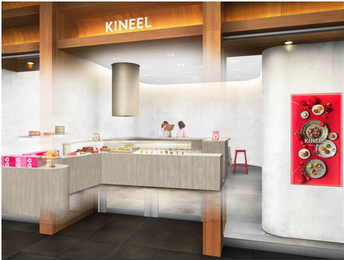
▲店舗イメージパース / イートイン6席予定