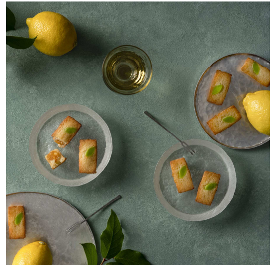
▲レモンがゴロっとジューシーな夏のフィナンシェ、「レモン an フィナンシェ」