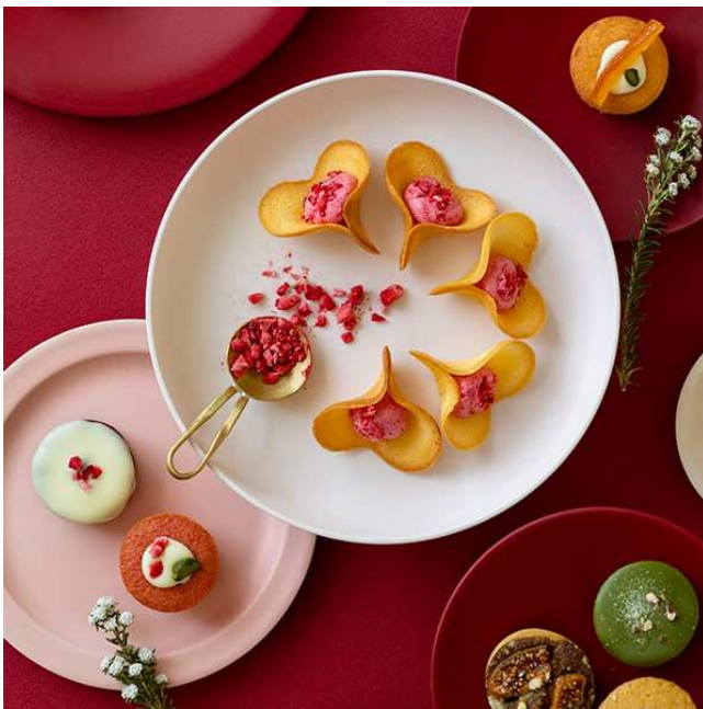
▲人気のルフルを中心とした焼き菓子