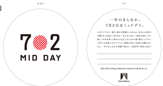
コースター イメージ

【日 程】 7月2日(水) 【場 所】 ショップ&レストラン 【主 催】 東京ミッドタウン