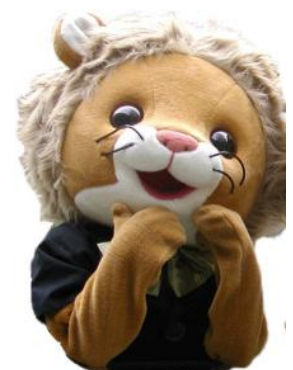
※ザ・リッツ・カールトン ライオン