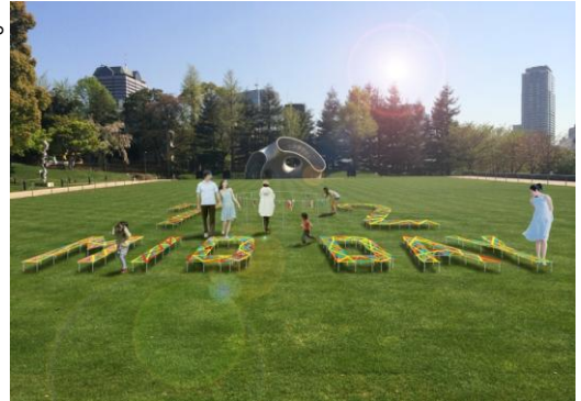
▲リボンを結ぶモニュメント