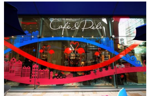
※「Tokyo Midtown DESIGN TOUCH 2013」 出展作品