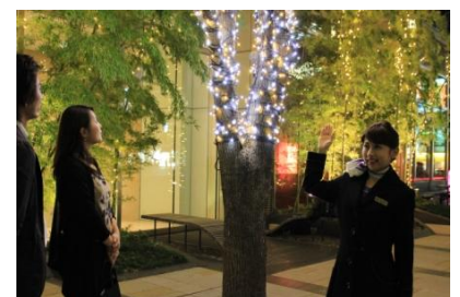
▲イルミネーションツアーの様子

【期 間】 11月30日(土)～12月19日(木) (予定) ※1日1～3回、1回あたりの所要時間約1時間 【予 約 方 法】 11月14日(木) (予定)より、東京ミッドタウンWEB サイトにて、受付電話番号をご案内いたします (※予約が埋まり次第終了) http://www.tokyo-midtown.com/ 【定 員】 各回10名 (予定) 【料 金】 一般1,500円、小学生700円(税込) (予定)