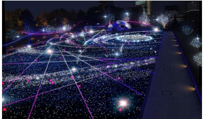
▲スターライトガーデン 2013 イメージ