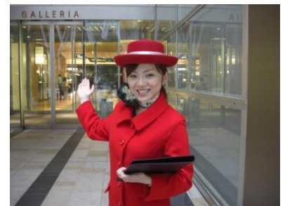
▲イルミネーションコンシェルジュ

【期 間】 11月30日(土)～12月25日(水) (予定) 【時 間】 18:00～20:00 (予定) 【場 所】 クリスマスイルミネーションエリア各所 (1日1名、赤色の制服を着用した専任スタッフ)