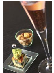
▲アペリティーボセット イメージ