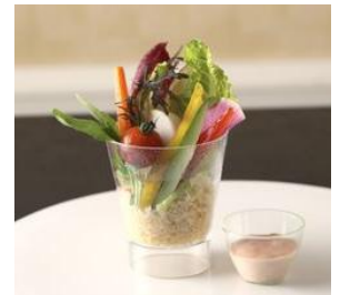
▲春野菜のスティックと桜ディップ