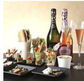
▲メニュー イメージ