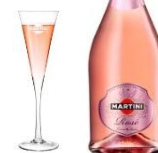
▲MARTINI ロゼ ボトル