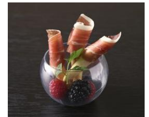
▲バルマ産生ハム、ピコスド・パン、 ミックスベリー