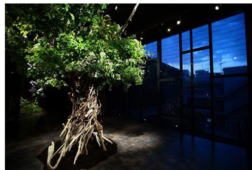
▲小野寺氏 過去の作品