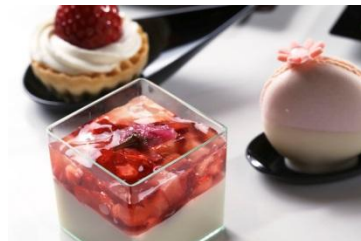
▲桜ブランマンジェ、ストロベリータルトレット 桜マカロン