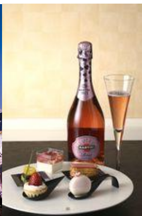
▲フード・ドリンクイメージ