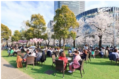
▲昨年の開催イメージ