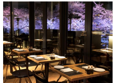
▲Artisan de la Truffe Paris