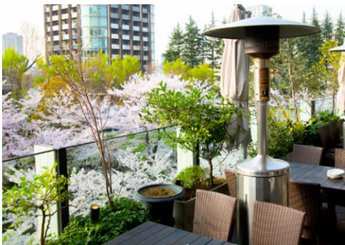
▲KNOCK CUCINA BUONA ITALIANA

館内のレストランでは春を感じるメニューが登場。春の心地よい風を感じることのできるテラス席でお過ごしいただくのもおすすめです。また、一部のレストラン、テラス席などからは、美しい桜や自然豊かなミッドタウン・ガーデン、さらにディナータイムではライトアップされた桜をご覧いただけます。旬の料理を味わいながら、春時間をご堪能ください。