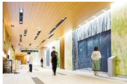
▲ TOKYO MIDTOWN AWARD 2021 展示の様子

※本リリースの掲載情報は予告なく変更となる場合がございます。あらかじめご了承ください。