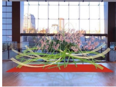
▲イメージ「FUJI-永劫のシンボル-」(ガレリア1F Bonpoint 前)