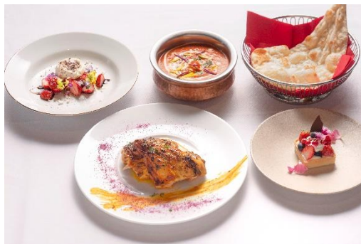
▲ブリフィックスコース(NIRVANA New York)