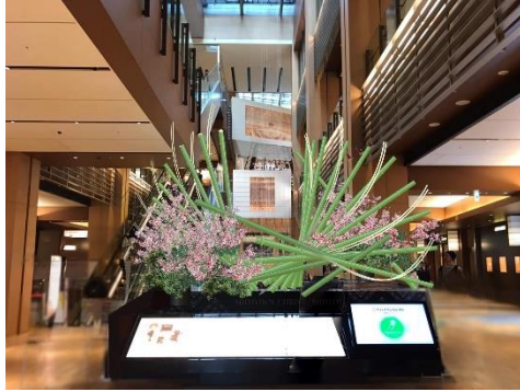
▲イメージ「BIRD-永劫の翼-」(ガレリア 1F ツリーシャワー)

深澤隆行による大型の花装飾が、今年はガレリア 1 階に 2 作品登場。テーマは「共存する未来に」。東京ミッドタウンに足を運んでくださる全ての皆様へ感謝を込めて、そして、ここに集う人々がそれぞれの目指す未来に飛躍するさまをイメージした作品「BIRD-永劫の翼-」と「FUJI-永劫のシンボル-」を展示いたします。さらにガレリア館内ではエビネやキンギアナムなど春の花々が期間中入れ替わりで登場。館内を巡りながら春の訪れをお楽しみください。