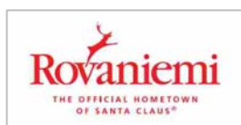
▲ロヴァニエミ市ロゴマーク