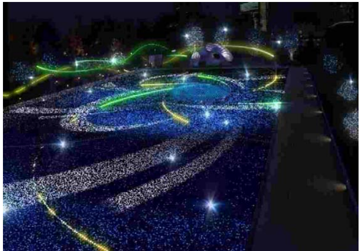
▲スターライトガーデン 2012 イメージ