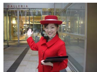
▲イルミネーションコンシェルジュ

【期 間】 12 月 1 日(土)～12 月 25 日(火) (予定) 【時 間】 18:00～20:00 (予定) 【場 所】 クリスマスイルミネーションエリア各所 (1 日 1 名、赤色の制服を着用した専任スタッフ)