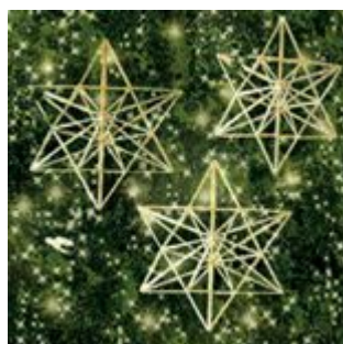
▲イメージ(ヒンメリ)