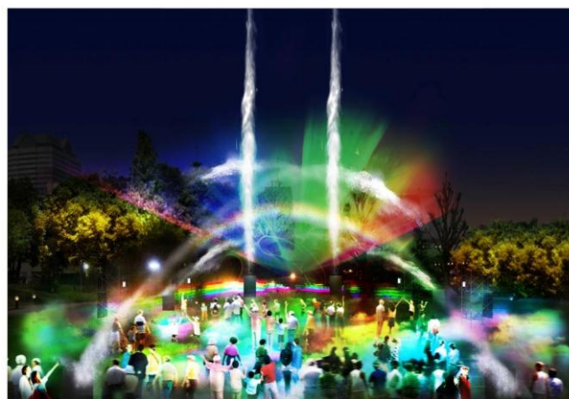
▲MIDTOWN WATER WORKS 2012(イメージ)

〒107-6205 東京都港区赤坂9-7-1 ミッドタウン・タワー5F Tel : 03-3475-3141/Fax : 03-3475-3144