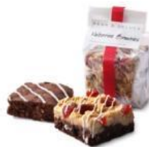
▲⑤『マンディアン』(ミルク) / 『ブラウニー』