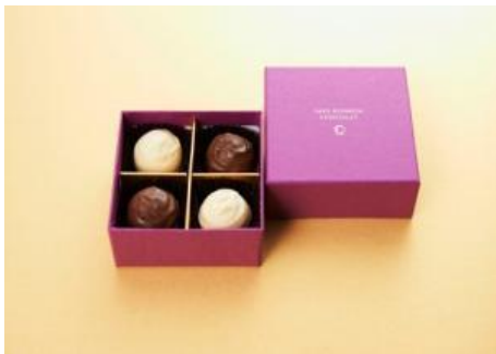
▲①『SAKEボンボンショコラ』

『マンディアン』(ミルク) 399円(税込) / 『ブラウニー』 630円(税込)