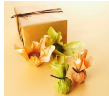
▲③『日本茶トリュフチョコレート』