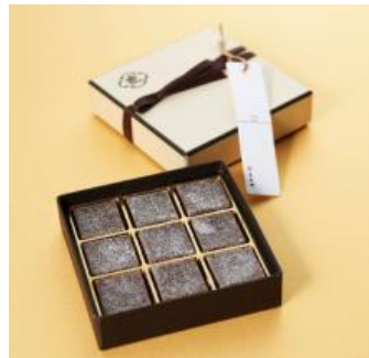
▲②『羊羹 au ショコラ』