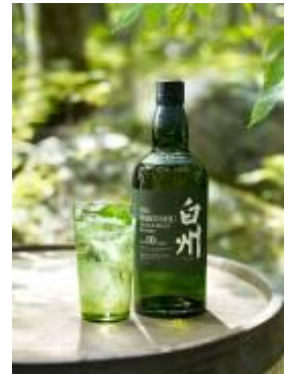
▲白州 森香るハイボール