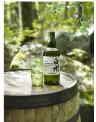
▲ 白州 森香るハイボール イメージ