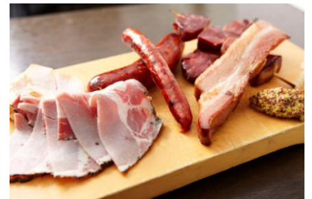
▲ 白州 ガーデンセット イメージ