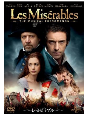
Film © 2012 Universal Studios. ALL RIGHTS RESERVED. Artwork © 2013 Universal Studios. ALL RIGHTS RESERVED.