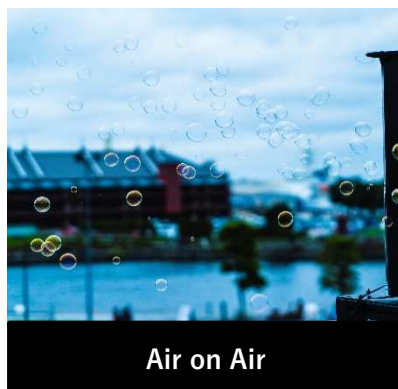
Air on Air