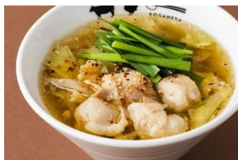
▲もつ鍋・水炊き KOGANEYA もつ鍋(醤油・味噌・旨辛)