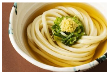
▲伊吹うどん かけうどん