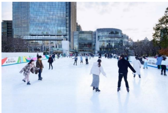
▲昼のイメージ(過去の様子)

東京ミッドタウンの冬の風物詩、「MITSUI FUDOSAN MIDTOWN ICE RINK(三井不動産 ミッドタウン アイスリンク)」が今年もウィンターシーズンを通して開催中。都内の屋外スケートリンクでは最大級かつ、本物の氷の上でスケートができ、日中は澄み切った冬空の下開放的な空間で、夜は柔らかな光に包まれ昼間とは違う雰囲気の中で、この街ならではのスケート体験をお楽しみください。