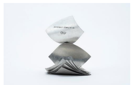
▲TOKYO MIDTOWN AWARD 2024 トロフィー

本トロフィーは北陸復興支援への想いを込め、富山県高岡市の伝統工芸士・職人達と共に創りました。アイデアが形になる過程の象徴としてデザインしたこのトロフィーを、受賞者の皆さんへ敬意を込めて贈ります。