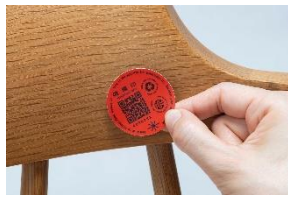
作品名:《循環印》 入選者: 小松崎慎梧