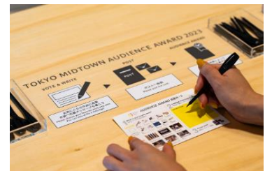
▲昨年のオーディエンス賞の様子

お寄せいただいた作品へのコメントは、クリエイターにも届けます。また投票にご参加いただいた方には、プラザインフォメーションカウンターにてオリジナルステッカーをプレゼント。(数量限定)