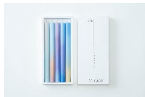
作品名:《toki-shirube》 入選者: Baumkuchen / 栗本真亜人・稲葉 巧・西門 亮