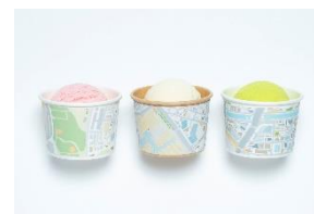
作品名:《MapCup》 入選者: 中村 綾