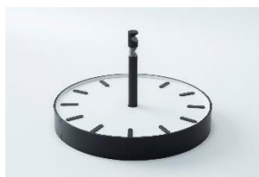
作品名:《灯台と小さな天体》 入選者: 一條遥貴