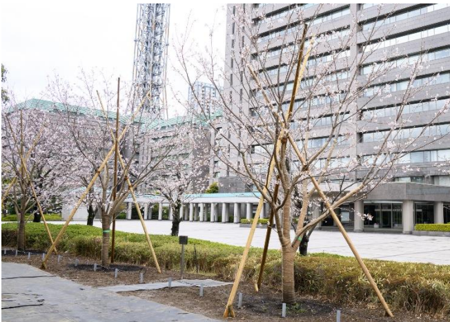
▲防衛省に植樹された桜の苗木(2025年4月の様子)

三井不動産株式会社および東京ミッドタウンマネジメント株式会社は、時間と共に熟成する緑あふれる「経年優化」の街づくりを進めています。過去から受け継いだ緑、街とともに創りあげた緑を、これからも50年、100年と大切に守り、育み、つないでいきます。