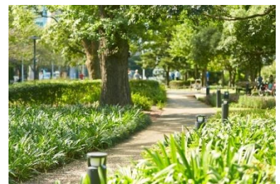
▲ミッドタウン・ガーデン