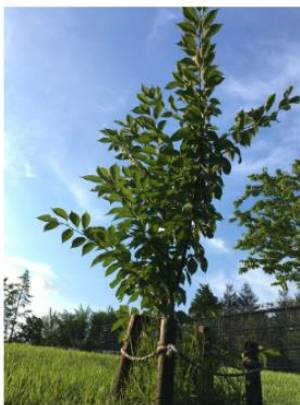
▲茨城県古河市で育成中の苗木 (2016 年 8 月)

現在は、茨城県古河市から千葉県木更津市に育成地を移し、今後、老木と若木の世代交代を進めながら、より自然に近い形で桜を受け継ぎ、この地の美しい景観を未来へとつないでいきます。