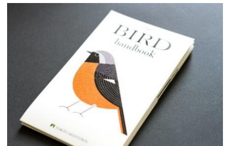
▲THE BIRD handbook

東京ミッドタウンでは、東京都の保護上重要な野生生物種を示したレッドリストに掲載されているオオタカ、ダイサギ、トビ、モズを含め、計6目18科25種の鳥類を確認しています。来街するお客様に気軽に都心の鳥を知っていただく取り組みとして、野鳥を紹介する「THE BIRD handbook」を作成し、館内にて配布も行っています。