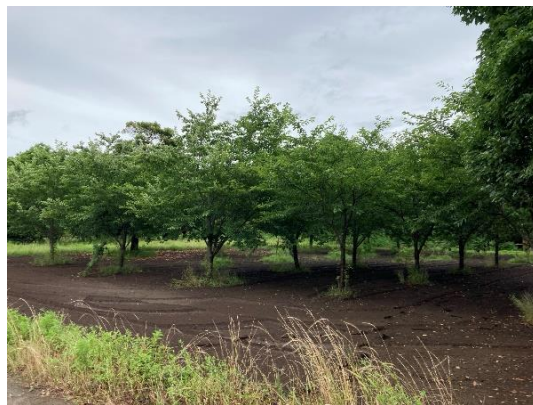
▲千葉県木更津市の圃場で育成中の苗木 (2024 年 7 月)