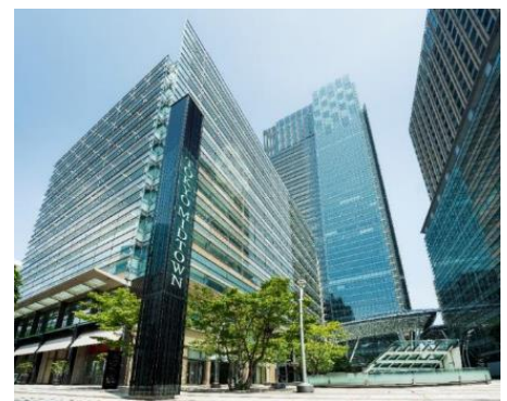
▲東京ミッドタウン外観

三井不動産グループは、時を経るごとに味わいを増し、魅力を増していく「経年優化」を街づくりの思想に掲げています。安心・安全の観点でも時代に合わせたアップデートを行い、「東京ミッドタウン」が年数を経るごとに魅力を増し、訪れる皆さまやテナント各社にとって「行きたくなる街」であり続けることを目指します。