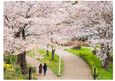
▲旧防衛庁時代から継承した桜

今後は市ヶ谷の地でも旧防衛庁時代の記憶を引き継ぎ、往時の見事な桜を再現することが期待されています。