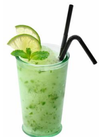
▲フローズンモヒート(イメージ)