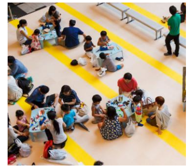
▲昨年のワークショップの様子