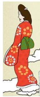
▲見返り美人 イメージ

【期 間】 8月8日(土)～8月16日(日) 【時 間】 11:00～18:00 ※なくなり次第終了 【場 所】 アトリウム 【料 金】 無料 【対 象】 未就学児～小学生 【主 催】 東京ミッドタウン 【協 力】 NHK エデュケーショナル そのほか、武蔵野美術大学デザインラウンジなどによるワークショップを日替わりで実施いたします。