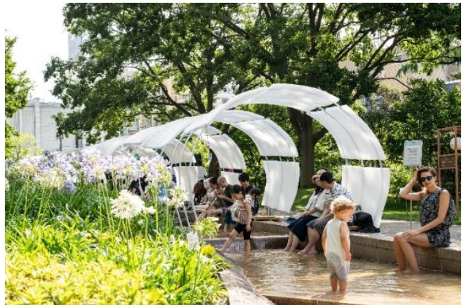
▲過去のイベントの様子