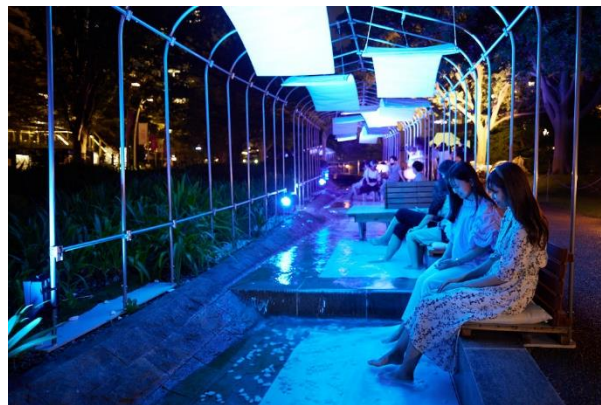
▲過去のイベントの様子

ミッドタウン・ガーデンを流れる小川に足を浸し、都会にいながら夕涼みをご体験いただける、「ASHIMIZU」。冷房に頼らない屋外でのエコロジカルな涼の取り方を体験いただけます。