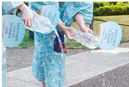
▲過去のイベントの様子

庭や道路に水を撒いて涼をとる、日本の昔ながらの風習である「打ち水」。今年は5年ぶりに“大暑の日”に復活！地域の皆様と一緒に、ヒートアイランド対策に取り組みます。打ち水には、東京ミッドタウンの地下貯水（雨水、井戸水等）を使用し、参加者にご持参いただいたペットボトルに入れて行います。街をあげてエコロジカルライフを目指す“都会の打ち水”を浴衣を着てご体験ください。