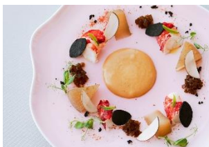
▲フィリップ・ミル東京

館内 16 店舗のレストラン・カフェでは、見て美しく、味わっておいしい、そんなアートな一皿をそれぞれご用意いたしました。