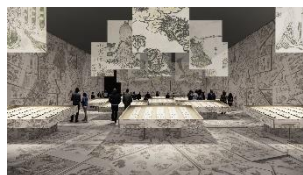
▲建築家・田根剛氏による『北斎漫画』展示プラン(イメージは構想段階のものです)

葛飾北斎の生誕 260 年を記念し、代表作である「富嶽三十六景」をはじめとする様々な作品が一堂に会する前代未聞の特別展が開催されます。