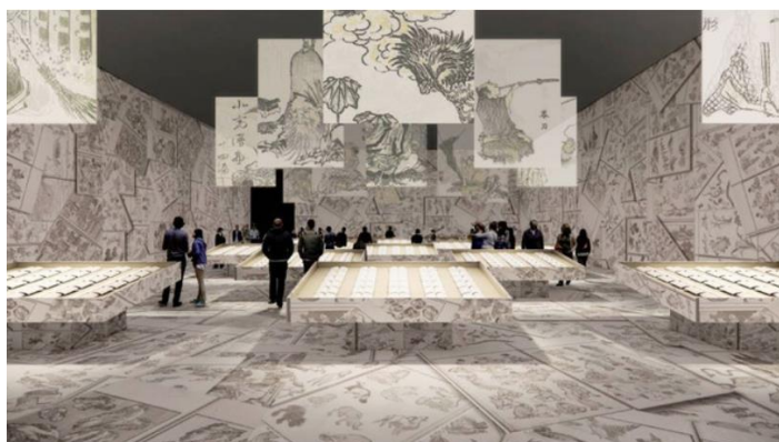
▲建築家・田根剛氏による『北斎漫画』展示プラン (イメージは構想段階のもので)

二十歳で浮世絵師としてデビューしてから九十歳で没するまでの七十年間、常に挑戦を続けて森羅万象を描き抜こうとした画狂の絵師・葛飾北斎。その生誕 260 年を記念し、代表作である『北斎漫画』、『富嶽三十六景』、『富嶽百景』の全頁(ページ)・全点・全図が一堂に会する前代未聞の特別展「北斎づくし」が東京ミッドタウン・ホールで開催します。