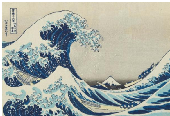
▲葛飾北斎「富嶽三十六景 神奈川沖浪裏」