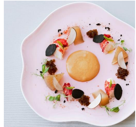
▲フィリップ・ミル東京

フィリップ・ミル 東京、宮川町 水簾、FUKAGAWA SEIJI 1894 ROYAL KILN & TEA、KNOCK CUCINA BUONA ITALIANA、NIRVANA New York、HAL YAMASHITA 東京、Toshi Yoroizuka、UNION SQUARE TOKYO、DEAN & DELUCA、pâtisserie Sadaharu AOKI paris、とらや、FRUITS IN LIFE、SAKE SHOP 福光屋、サン・フルーツ、Ron Herman、TACO RiCO